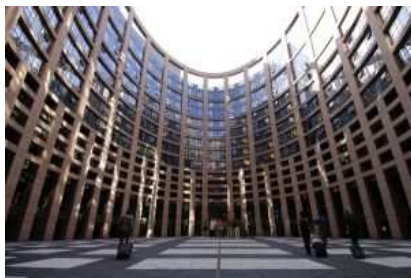
Európa 2020. Stratégia

Az Európai Unió versenyképességének fejlesztését célzó, tíz éves Lisszaboni Stratégia 2010-ben ért véget. Az új stratégiát, az Európa 2020 Stratégiát az Európai Bizottság dolgozta ki, az Európai Tanács 2010. júniusában fogadta el.