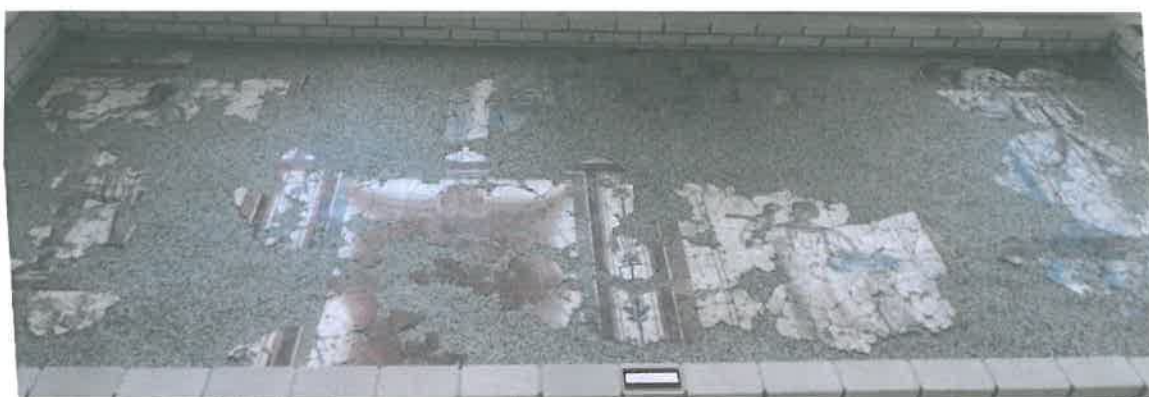
A Lakomajelenetes falfestmény