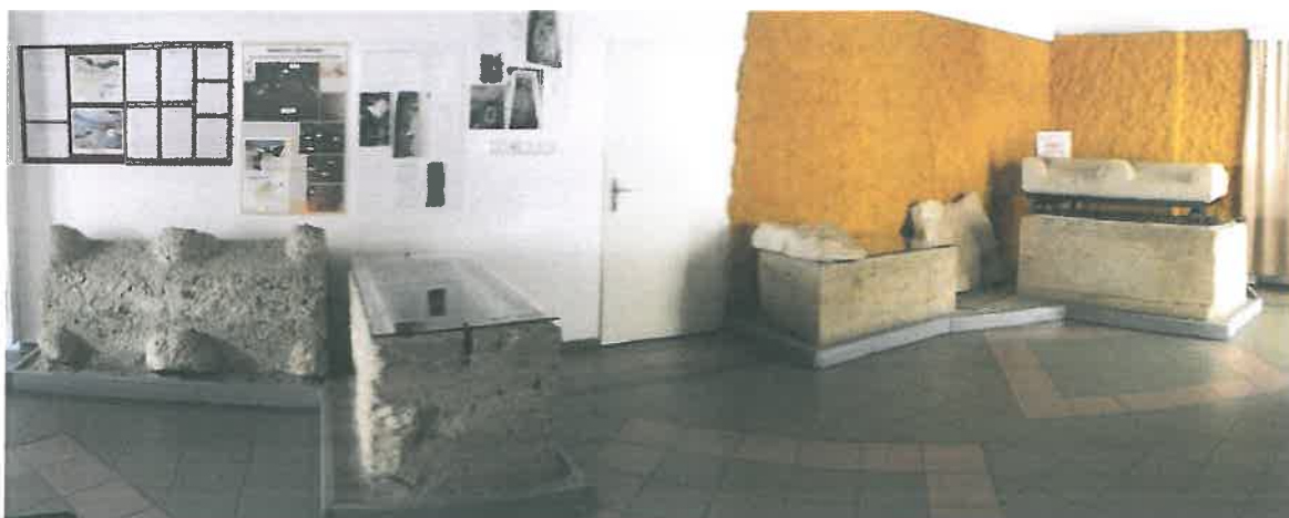
Részletek a „Brigetio kincsei” állandó kiállításból