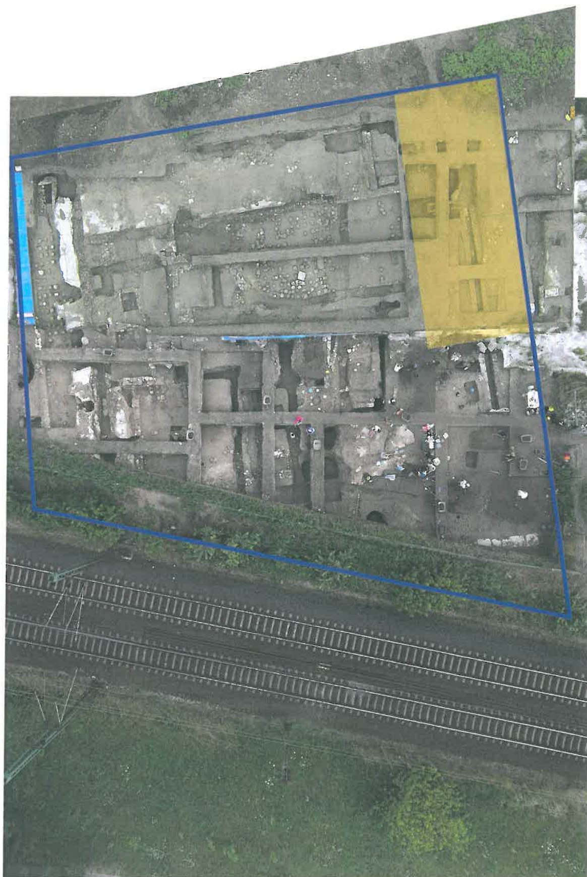
A brigetiói római fürdő felülnézetből, 2016 októberében - a tervezett, kék vonallal lehatárolt védőépület és a sárgával jelzett látogatóközpont jelölésével