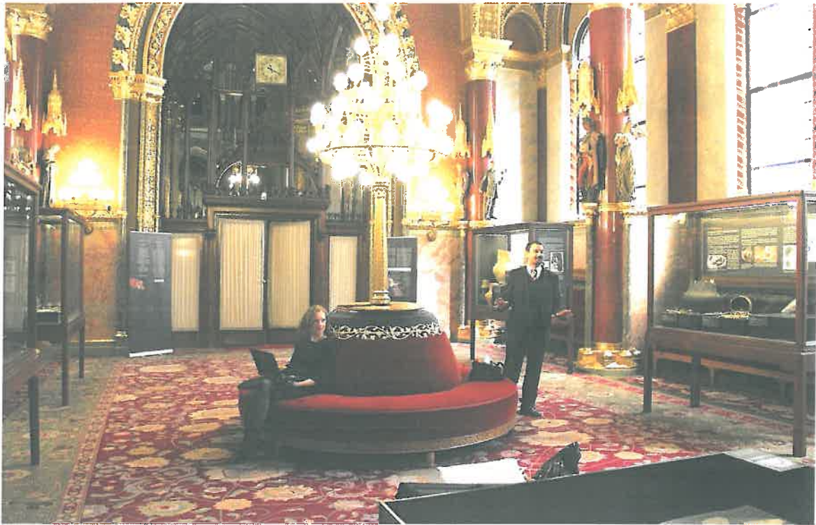
A „Megmentett örökség” című kiállítás a Parlamentben. Előtérben a földön lévő tárlóban a brigetiói mennyezetfestmény

A múzeum és ezzel Komárom városa 2014-ben két újabb régészeti szenzációval lett gazdagabb.