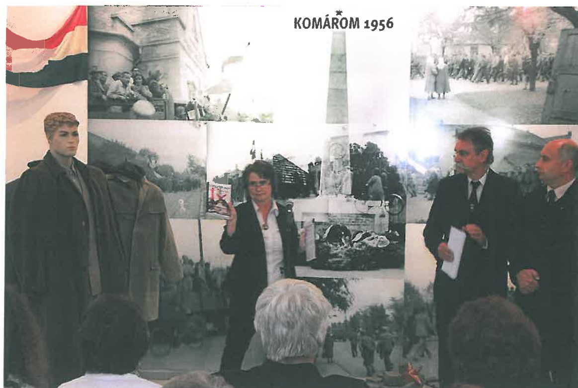
1956 komáromi eseményei című kiállítás megnyitója (2016. X. 21.)

Helyhiány miatt a múzeum csak időszakos jelleggel tud helytörténeti, néprajzi és képzőművészeti kiállításokat rendezni. Több kiállítás-sorozatunk is van: a Komáromi mesterségek (pingálósasztalosok - 2005, aranymosók - 2007, szekeresszázadok - 2009, molnárok - 2011, halászok - 2013, csizmadiák-cipészek - 2015), a Régi és népszerű komáromi foglalkozások (vasutasok - 2010, vám-és pénzügyőrök - 2011, tűzoltók - 2012,) Kiemelt évfordulók (110 éves az Erzsébet híd - 2002, 100 éves a komáromi lótenyésztés - 2004, Új-Szöny és Komárom egyesítésének 110. évfordulója - 2006, Komárom és településrészeinek egyesítése - 2007, Visszacsatolás 70. évfordulója - 2008, 100 éves a komáromi erődrendszer - 2009, a nagy komáromi földrengés 230. évfordulója - 2013, 100 éves a Solymosy-Gyürky kastély - 2013, Holokauszt 70. évfordulója - 2014, 750 éves Komárom - 2015, 1956-os forradalom és szabadságharc 60. évfordulója - 2016), Komárom egyházi életének feldolgozása (katolikus egyház - 2015, protestáns egyházak - 2017), Komárom neves szülöttei, személyei (Jókai képzőművészete - 2000, Zsolt Béla író halálának 60. évfordulója - 2009, Rafael Viktor Győző festőművész születésének 110. évfordulója - 2010, Klapka György halálának 120. évfordulója - 2012).