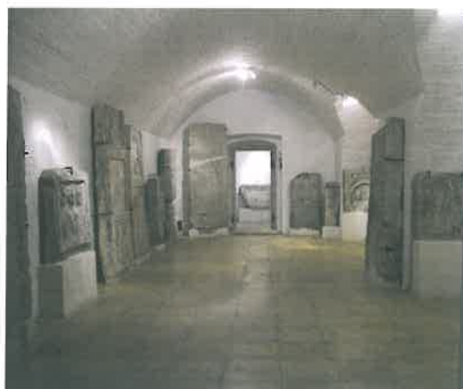
A római kőtár az Igmándi erődben