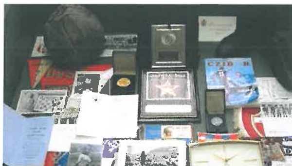
A tengerészeti gyűjtemény és a Cibor Emlékszoba részlete