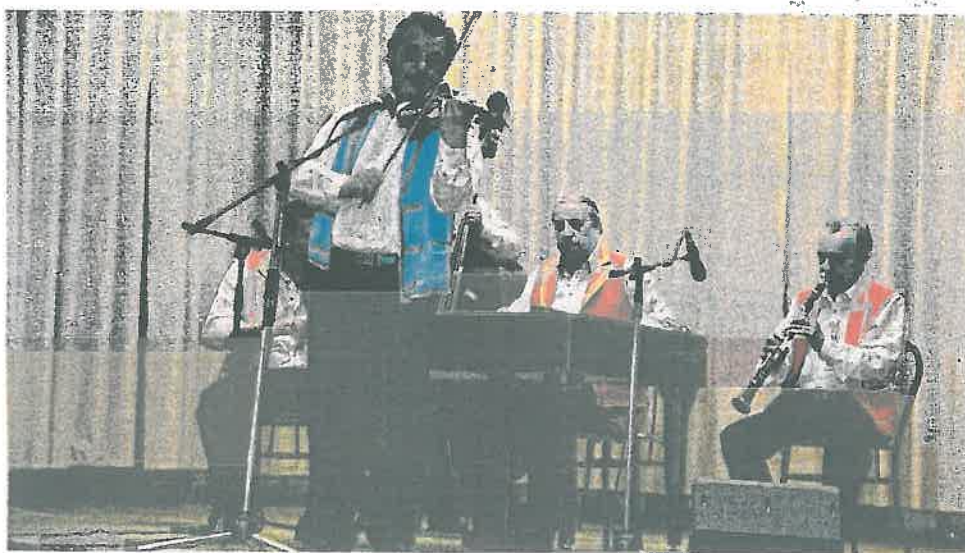
Tárkányban délután már a kultúra volt a főszerep, előadók, együttesek is megmutatta tudásukat