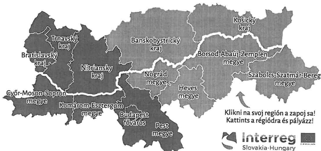
Táblázat 14.: A programterület teljes szlovák-magyar határszakaszának megoszlása megyénként (km; %)